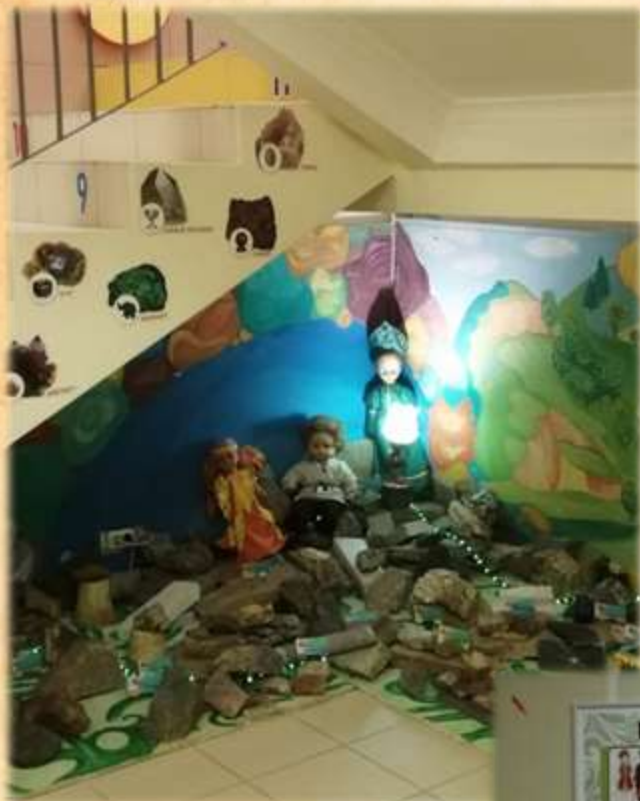
Музей «Самоцветы Урала»