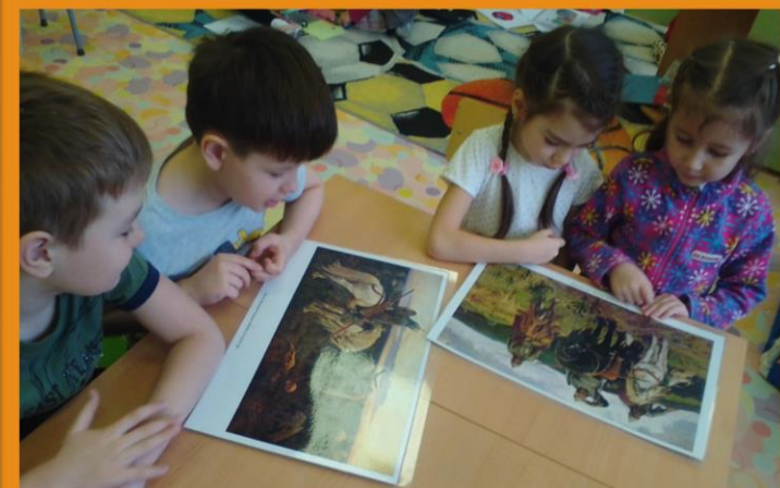
Рассматривание и обсуждение по картинам