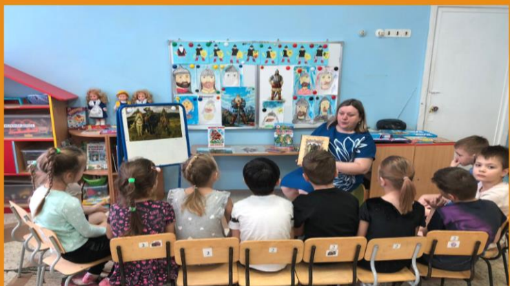
Беседы о богатырской славе