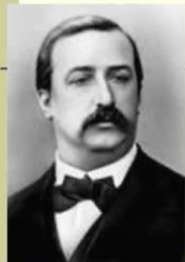
Александр Порфирьевич Бородин

Первая русская классическая Симфония №2 – «Богатырская»