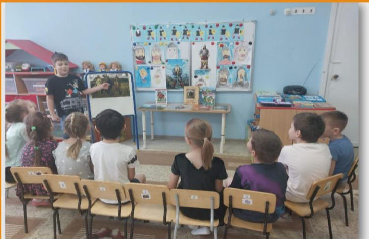
Составление рассказов по картине В. Васнецова «Богатыри»